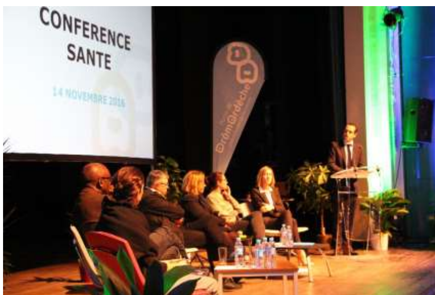
Elus, professionnels de santé et partenaires lors de la Conférence santé Saint-Vallier, le 14 novembre 2016

Le 14 novembre 2016, plus de 120 personnes assistent à une Conférence Santé à laquelle était convié l'ensemble des élus et des professionnels de santé du territoire ; c'est à cette occasion que sont présentées les conclusions du Portrait santé de Porte de DrômArdèche commandé à l'Observatoire Régional de Santé (ORS).