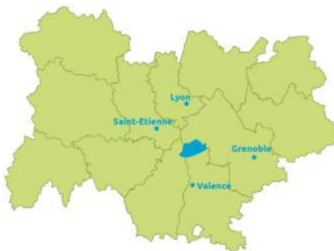
Situation de Porte de DrômArdèche en Région Auvergne-Rhône-Alpes

La Communauté de communes Porte de DrômArdèche s'étend au nord des départements de la Drôme et de l' Ardèche , de part et d'autre du Rhône. Administrativement, elle a été créée en 2014 suite à la fusion de 4 Communautés de communes : Rhône Valloire, Les Deux Rives, La Galaure et Les 4 collines. Elle regroupe aujourd'hui 35 communes (8 en Ardèche et 27 en Drôme) et près de 48 000 habitants . Elle est la 4ème intercommunalité de la Drôme.