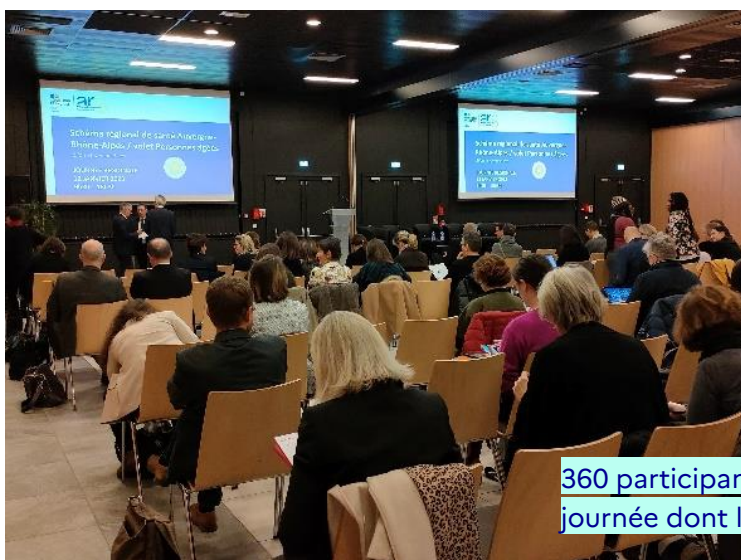
360 participants ont participé à cette journée dont la moitié à distance