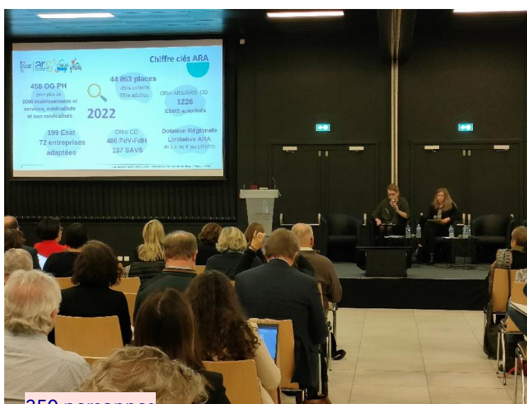
250 personnes ont participé à cette journée